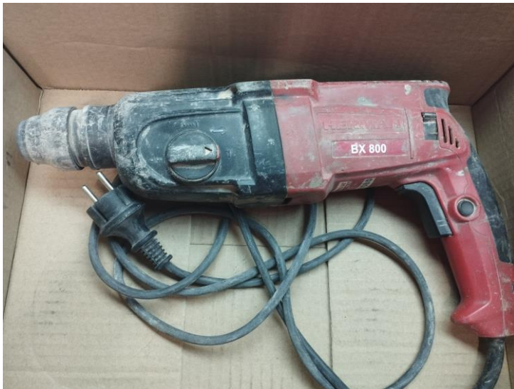
Obr.1 Stav náradia pri prijme