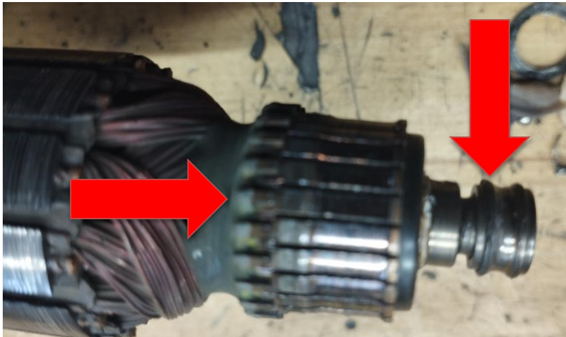
Obr.4 Poškodenie komutátora rotora a rozpadnutie ložiska