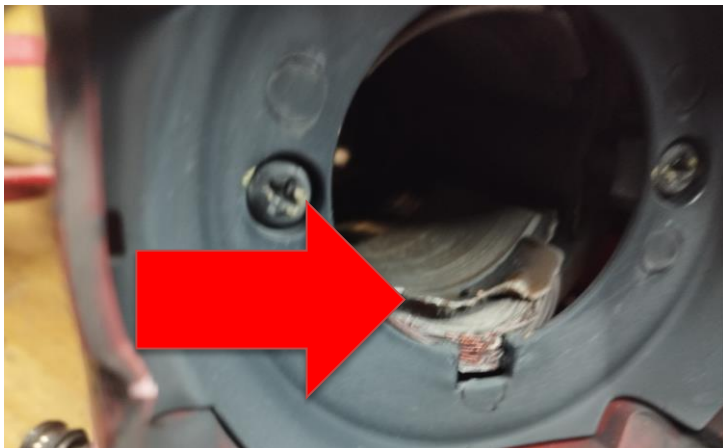
Obr.2 Poškodenie vinutie statora