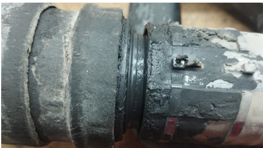
Obr.2 Uvoľnený predný kryt valca