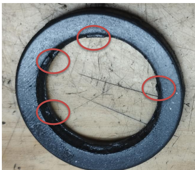
Obr.5 Poškodenie gumového tmiča piestu