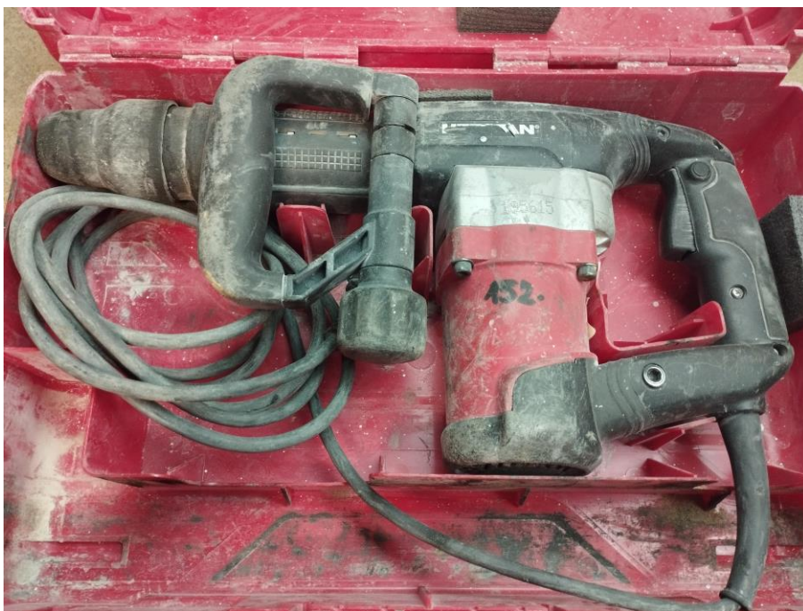
Obr.1 Stav náradia pri prijme